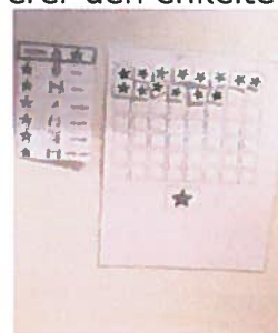
Belønning med stjernesystem